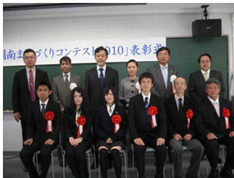
周南まちづくりコンテスト2010（平成22年11月）

徳山大学ウェブサイトでは、最新情報を含めて徳山大学の様々な情報を提供しています。