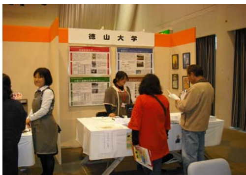
「すぞわざスタジアム」に出展（平成22年10月）