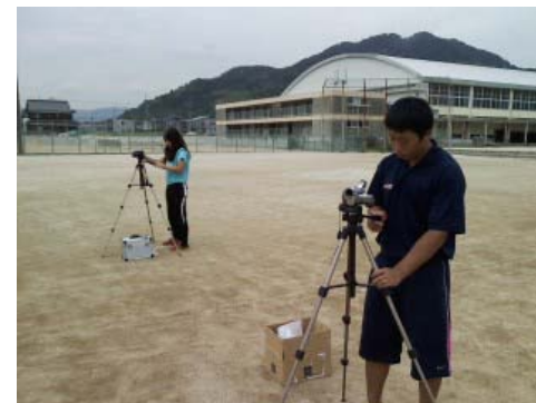
地元中学校で保健体育科の授業研究（平成22年9月）

4年生が作成した卒業論文（卒業制作）の要旨をとりまとめた卒論概要集を作成・発行します。